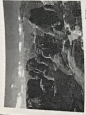
Paísaje característico de las zonas con clima mediterráneo.