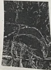
Vegetación característica de la savana.