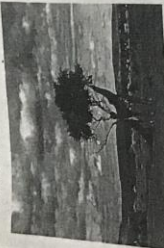
Paisaje de savana.