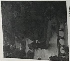
Paísaje característico de las zonas con clima atlántico.