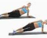
18 Side Plank