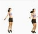
1 Jump Rope