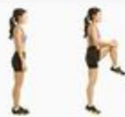
3 High Knees