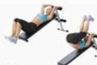
25 Reverse Crunch