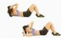
22 Oblique Crunch