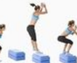
33 Box Jump