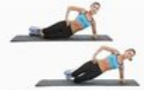
17 Kneeling Side Plank