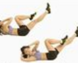
23 Bicycle Crunch