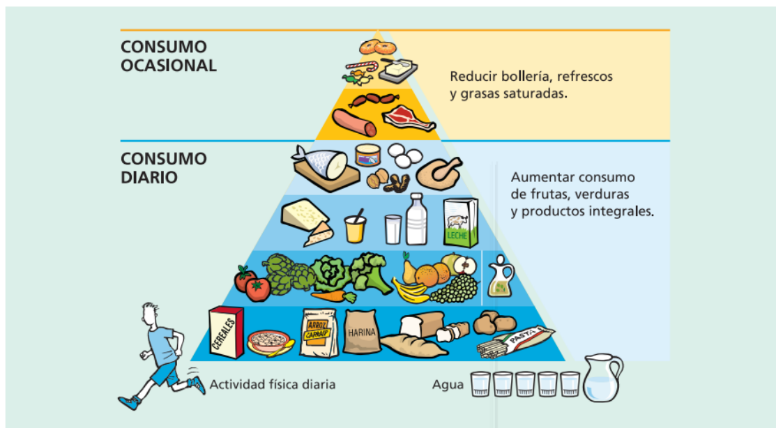
Pirámide de la alimentación saludable. SENC 2007.

¡Ojo! En condiciones normales, si no nos movemos, no necesitaríamos tantas. Intenta hacer ejercicio diario en un rincón de la casa.