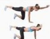
14 Bird Dog