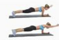
20 Diagonal Plank