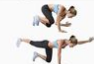
15 Horse Stance