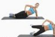
35 Side Hip Abduct