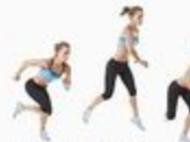
32 Side Skater Jump