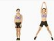
2 Jumping Jack