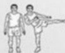
side leg raises