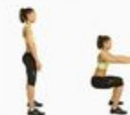
26 Wall Sit