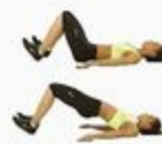
31 Butt Bridge