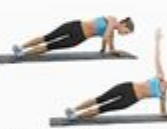
19 Side Plank Reach