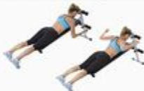
12 Incline W-Raise