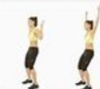
6 Wall Slide