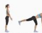
34 One-Leg RDL