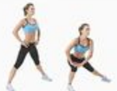
29 Side Lunge