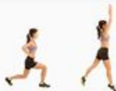
4 Split Jump