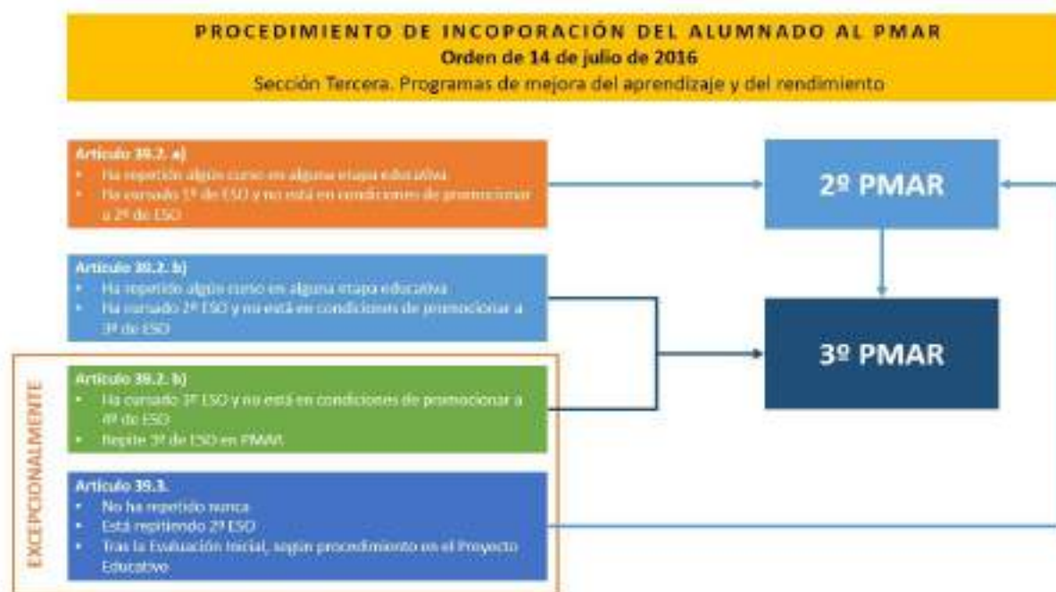
Ilustración 3 Proceso de incorporación al PMAR