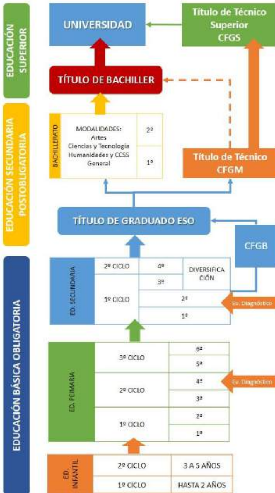
Ilustración 2 Sistema educativo LOMLOE. Elaboración propia