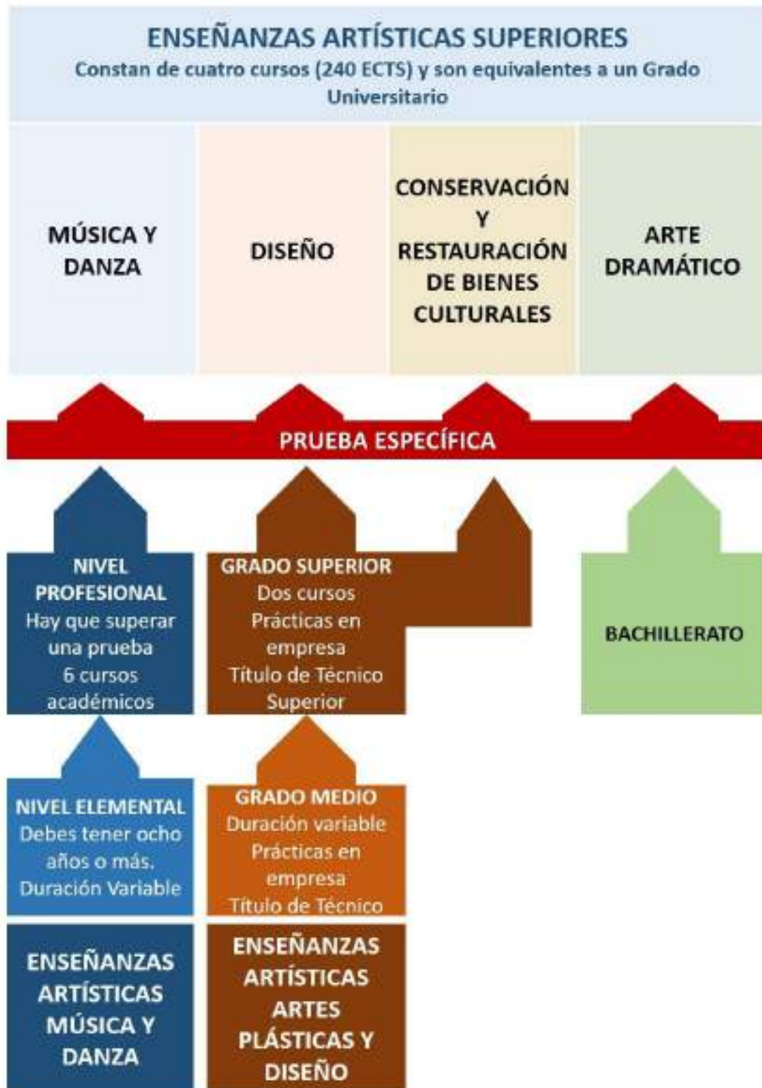
Ilustración 6 Esquema básico de organización de las enseñanzas artísticas

Reguladas por el Real decreto 1614/2009, de 26 de octubre